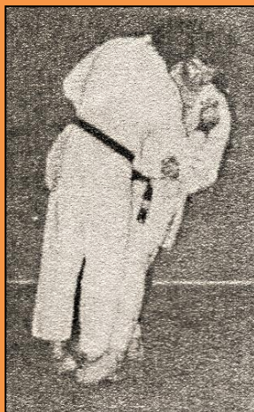
OKURI ASHI BARAI