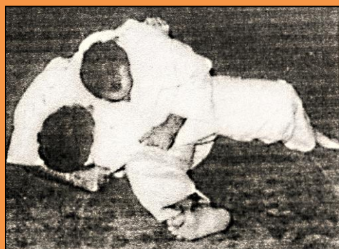
HON GESA GATAME