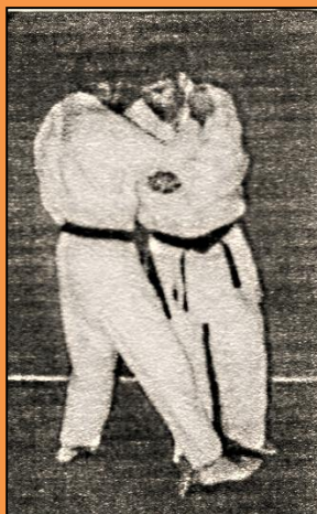
KO UCHI GARI