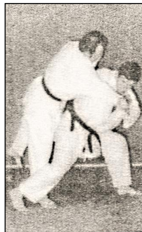
TAI OTOSHI Renversement du corps