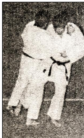
O SOTO GARI Grand fauchage extérieur