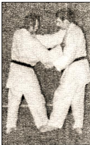
DE ASHI BARAI Balayage du pied avancé