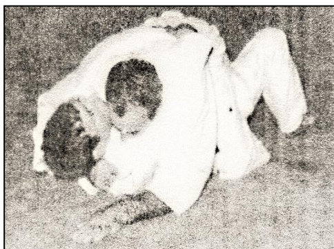
TATE SHIHO GATAME Contrôle à cheval par les quatre points