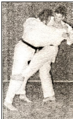
HIZA GURUMA Roue autour du genou