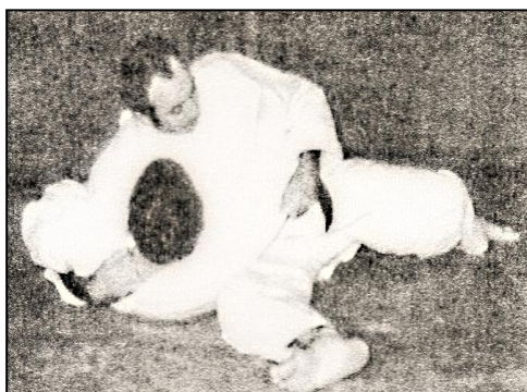
KUZURE GESA GATAME Variante du contrôle fondamental par le travers